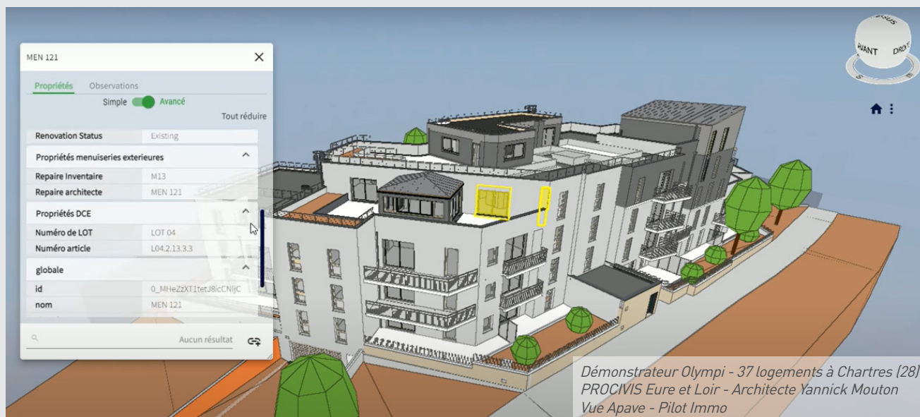
Démonstrateur Olympi - 37 logements à Chartres (28) PROCIVIS Eure et Loir - Architecte Yannick Mouton Vue Apave - Pilot Immo

Pilot Immo : plateforme BIM de données unifiées, structurées, sécurisées et partagées par tous les acteurs.